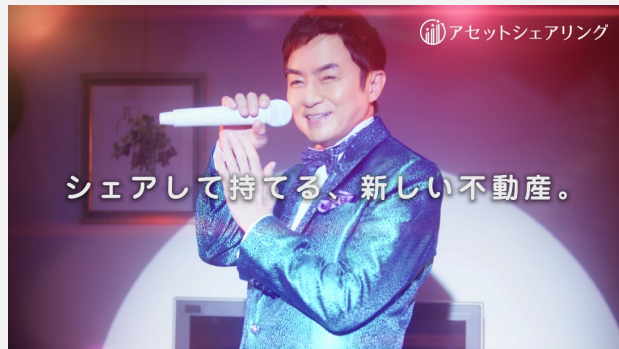
▲ イメージキャラクター 西郷輝彦